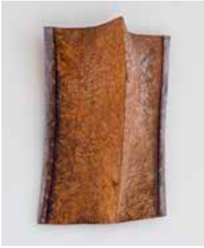
2009, Eiche, Eisen, Schellack, 67 x 51 x 15 cm