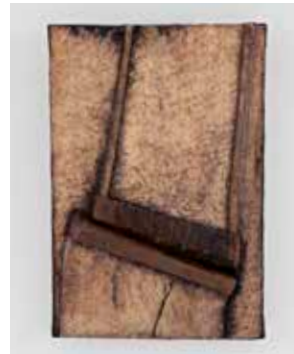
2012, Eiche, Eisen, oxidiert, 39 x 26 x 7 cm