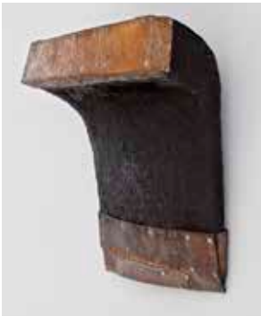
2011, Eiche, Eisen, in Eichenlauge geschwärzt, 43 x 41 x 18 cm