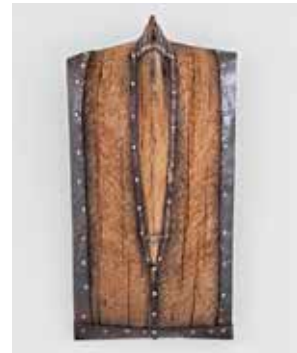
2012, Eiche, Eisen, oxidiert, geölt, 37 x 22 x 14 cm