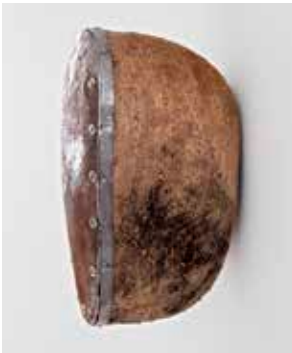
2012, Eiche, Eisen, unbehandelt, 24 x 13 x 16 cm