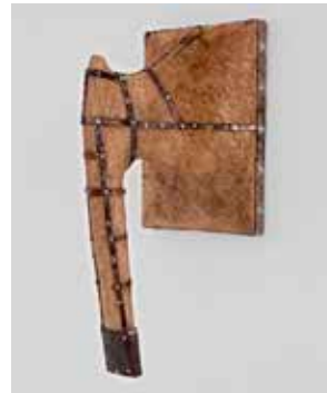
2012, Eiche, Eisen, unbehandelt, 21 x 27 x 15 cm