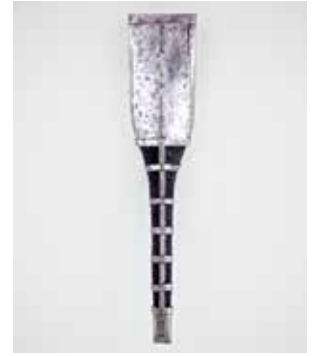
2011, Eiche, Eisen(blank), in Eichenlauge geschwärzt, 65 x 14 x 17cm