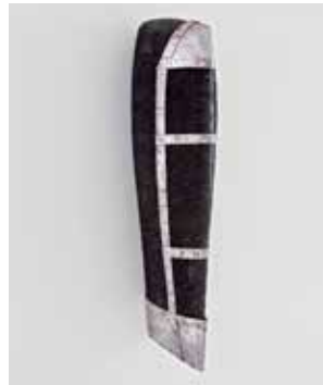
2011, Eiche, Eisen(blank), in Eichenlauge geschwärzt, 80 x 16 x 26 cm