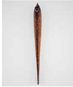
2010, Eiche, Eisen, Schellack, 70 x 7 x 9 cm