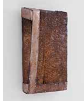
2011, Eiche, Eisen, oxidiert, geölt, 66 x 38 x 14 cm