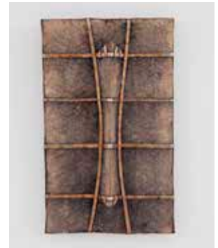
2012, Eiche, Eisen, oxidiert, 43 x 25 x 7a cm